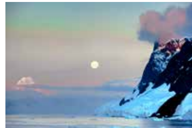
MUR DE L'UNIVERSALITÉ (32 PHOTOGRAPHIES) , AVENUE À LA VICTOIRE, VERDUN