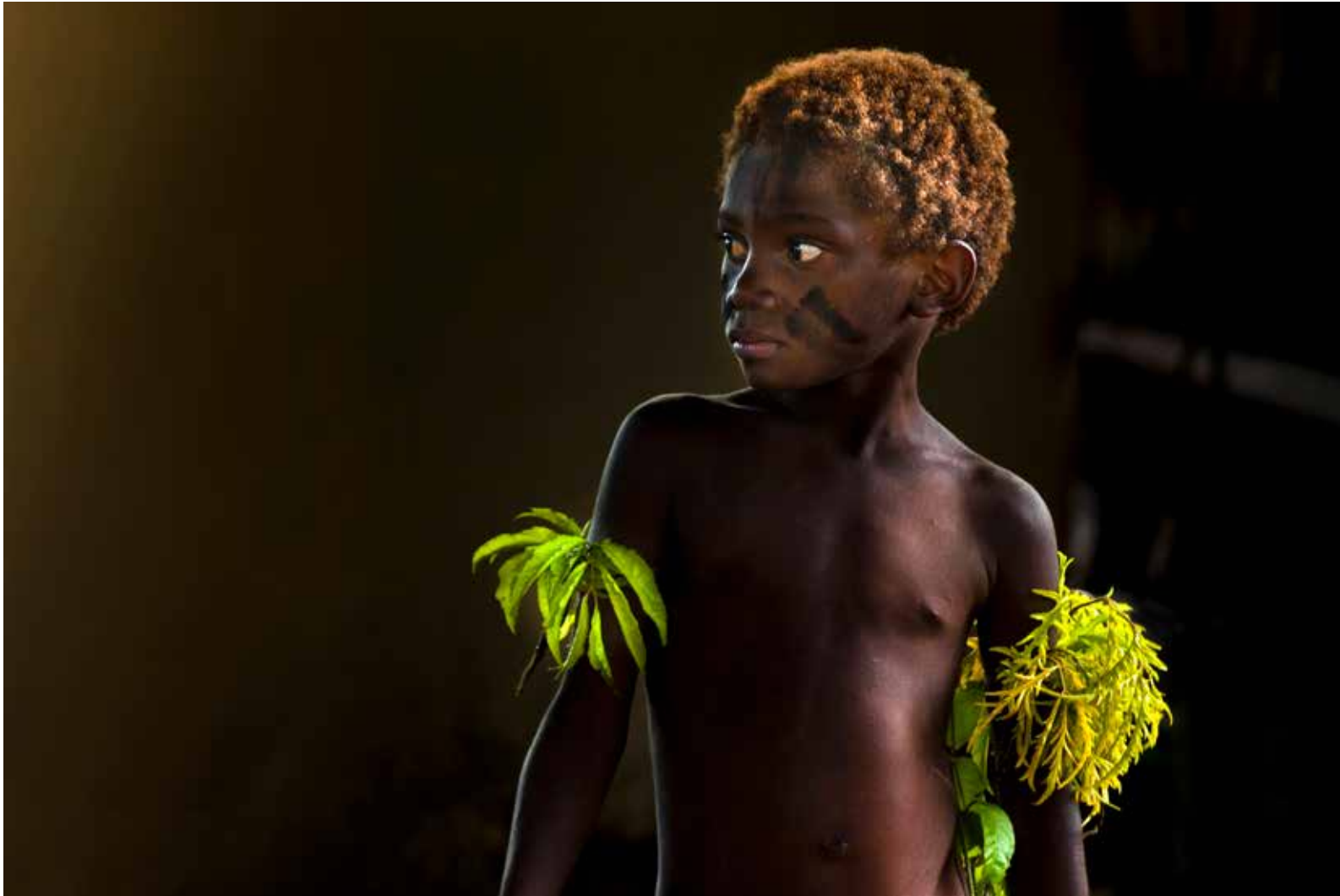
MARCHÉ COUVERT, VERDUN