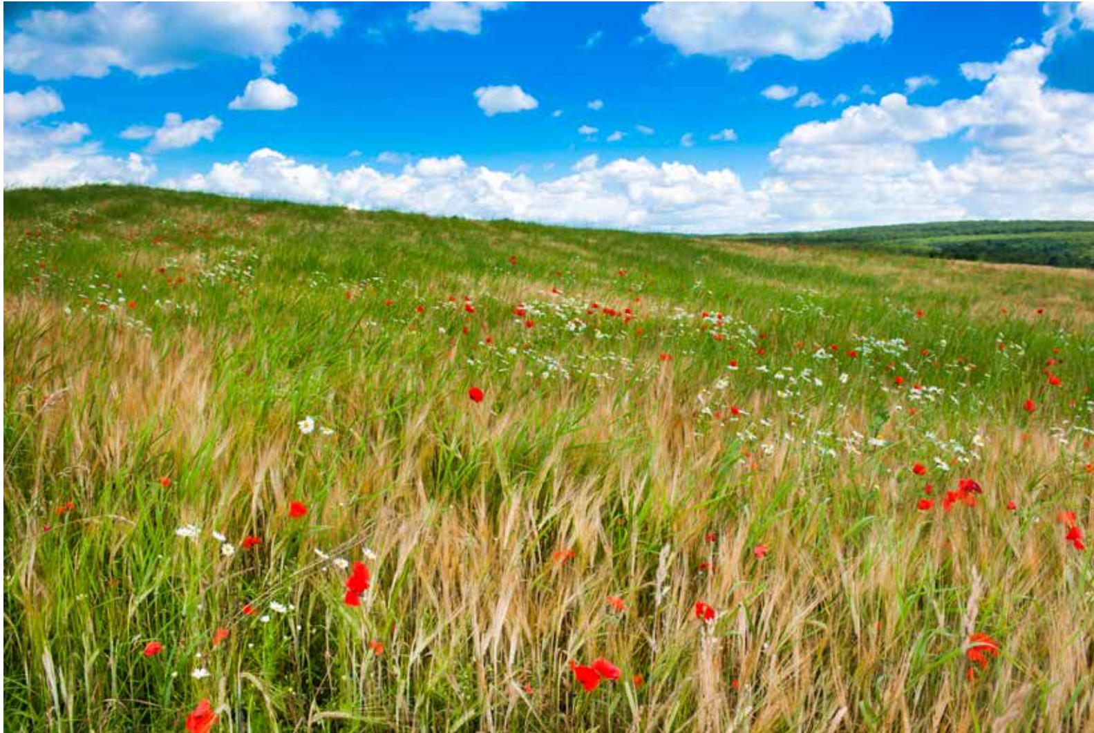
MÉMORIAL DE VERDUN, FLEURY-DEVANT-DOUAUMONT (JUSQU'AU 10 JUIN)