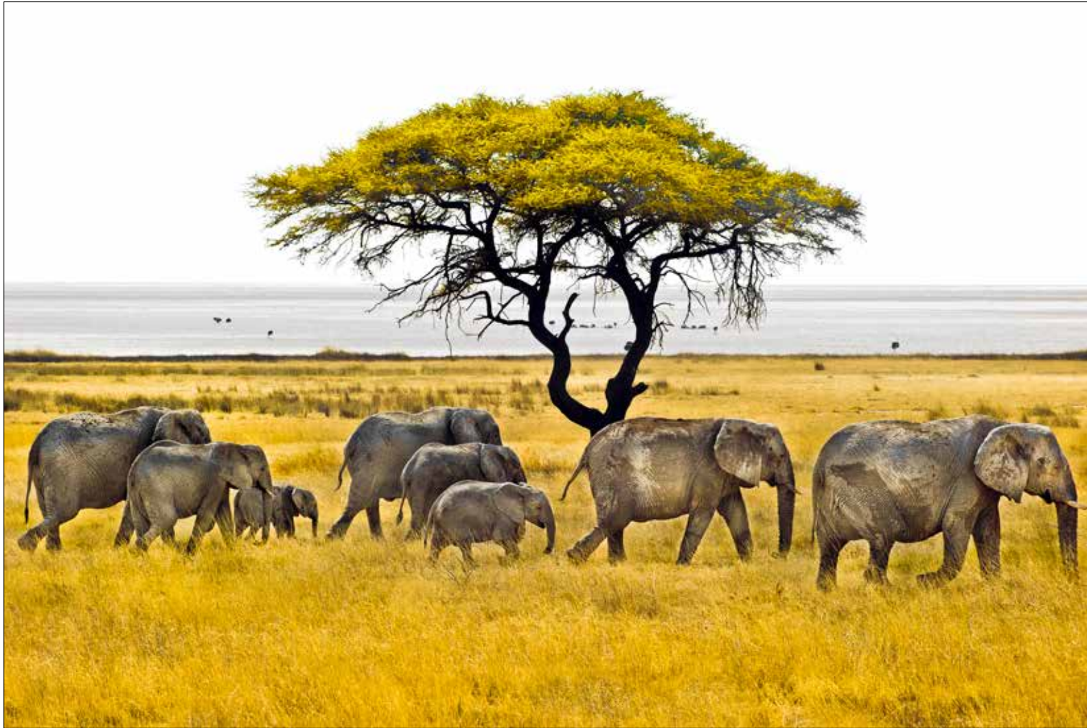
GARE MEUSE TGV, LIEU DIT LE CUGNET, LES TROIS-DOMAINES